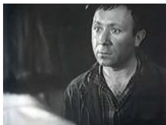
"Проводы белых ночей" (1969)

В 1977 г. Ефим Александрович Каменецкий удостоен почетного звания «Заслуженный артист РСФСР», в 2008 г. «Народный артист России».