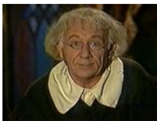
"Легенда о Тиле" (1997)