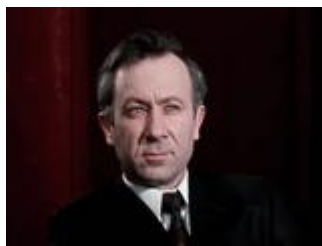
"Ковалёва из провинции" (1975)