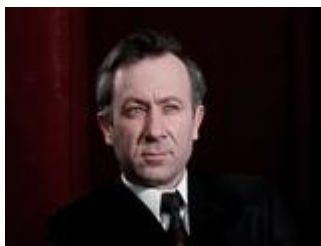
"Ковалёва из провинции" (1975)