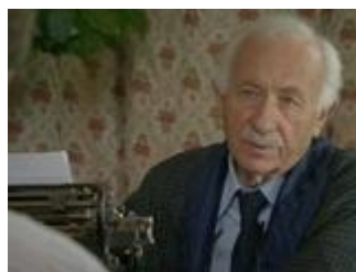
"Улицы разбитых фонарей-11" (2011)