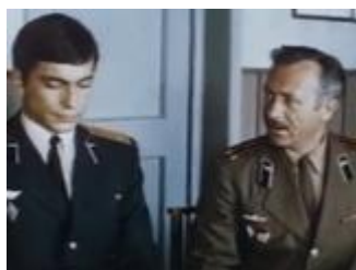
"Строгая мужская жизнь" (1977)